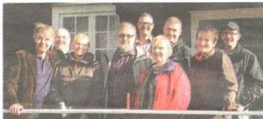
SAMLADE. Kommunrepresentanter och medverkande från ekomuseum utanför Mårdaklevs kvarn.